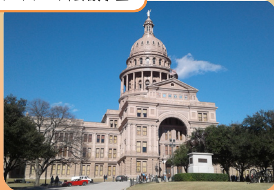
テキサス州会議事堂

2019年11月20日(水)13:30-15:30 富山大学人文学部・1階・大会議室