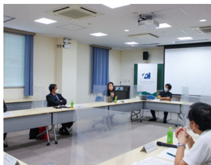
▲ 協定校海外招へい者との協議の様子