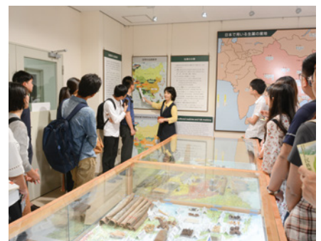
▲ 民族薬物資料館見学の様子