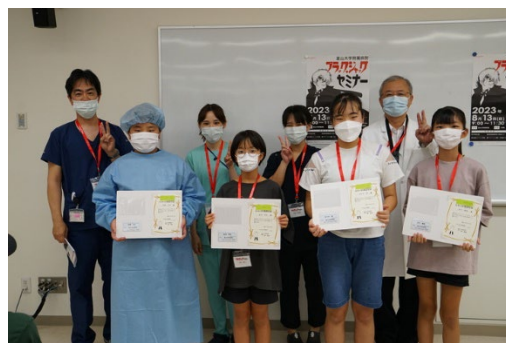
過去に実施したセミナーの様子